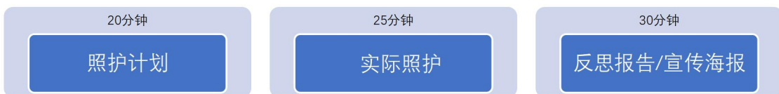
图 1 单一模块竞赛顺序

选手参加竞赛，首先进入“照护计划”竞赛区，在规定的时时间（20分钟）阅读案例及相关信息资料，制定并撰写案例照护计划；然后进入此模块的“实际照护”竞赛区，利用现有的资源，自取用物，与 SP 配合，完成规定的任务，实现对 SP 的自主和独立的健康与社会照护过程（25分钟）；最后进入模块“反思报告/健康教育海报”竞赛区完成最后任务（30分钟）。裁判在旁观察及评分，不予提问和干扰。选手不需要向裁判做任何解释和交流。如图 1。